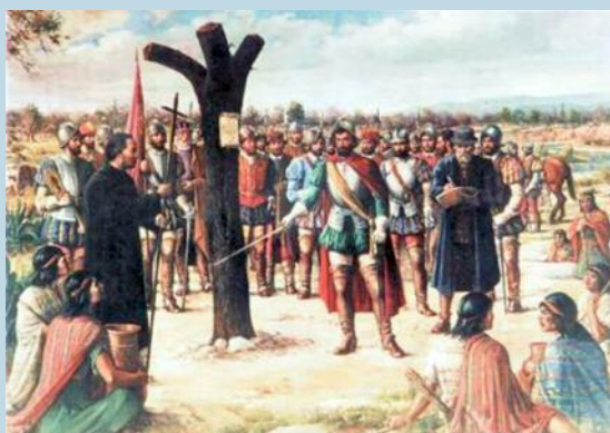
Fundación de Córdoba

6 de Julio de 1573: Todavía no se habían fundado Salta y Jujuy, cuando los pobladores del Alto Perú comenzaron a buscar una salida al océano Atlántico para llegar a Europa, pasando por la zona del Rio de la Plata. Es Jerónimo Luis de Cabrera quien funda, a orillas del Rio Suquia, en un territorio que denomina Nueva Andalucía, una población a la que pondrá el nombre de Córdoba. Cuatro años después, en el año 1577, será trasladada a