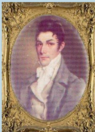
Martín de Álzaga

2 de Julio de 1812: El antiguo funcionario del Cabildo de Buenos Aires, Alcalde de Primer Voto y héroe de la defensa de la ciudad de Buenos Aires durante la segunda invasión inglesa, Martín de Álzaga, había organizado una conspiración para derrocar al gobierno criollo, que en ese entonces era el Triunvirato. Obtuvo dinero de comerciantes españoles, conexiones con Montevideo y la flotilla española, y el jefe portugués Souza con fuerzas en Uruguay. Las noticias llegaron a las autoridades criollas antes de que la rebelión se iniciase. Inmediatamente se ordenó la captura de los conspiradores. Álzaga y los demás jefes de la rebelión fueron ejecutados.