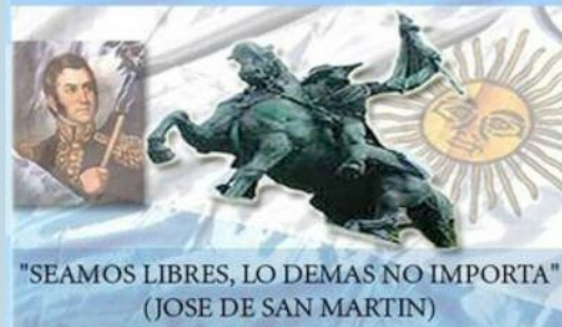
"SEAMOS LIBRES, LO DEMAS NO IMPORTA" (JOSE DE SAN MARTIN)

de gobierno se limitara a una monarquía "casi" constitucional y que fuera un inca coronado rey de estas tierras, pues eran ellos los legítimos dueños de ella. Tres días después, el 9 de Julio de 1816 siendo presidente del Congreso, el Sanjuanino Francisco Narciso Laprida se leyó el plan de tareas que se había preparado. Con mucho público en las afueras de la Casa, los diputados ordenaron al secretario Juan José Paso presentar la propuesta para que sea votada y fue entonces que se escuchó la siguiente y esperada pregunta "...si querían que las provincias de la Unión fuesen una Nación libre e independiente de los reyes de España y su metróli....Puestos de pie los Sres. Diputados aclamaron la Independencia; el destino de la Patria estaba decidido: Libres. Diez días más tarde, el 19 de Julio en sesión secreta, a pedido del Diputado Pedro Medrano se aceptó que a la declaración de la Independencia "de Fernando VII, sus sucesores y metróli" se agregara "y de toda otra dominación extranjera".